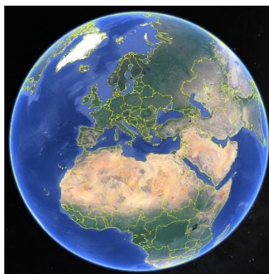
Slika 1: Naš planet Zemlja.

Minden évben, április 22-én a Földünk ünnepe.