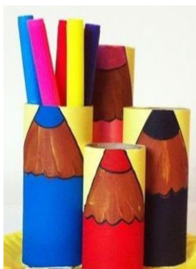
Slika 3: Stojalo za barvice.