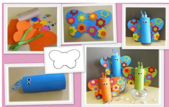
Slika 4: Metulj.